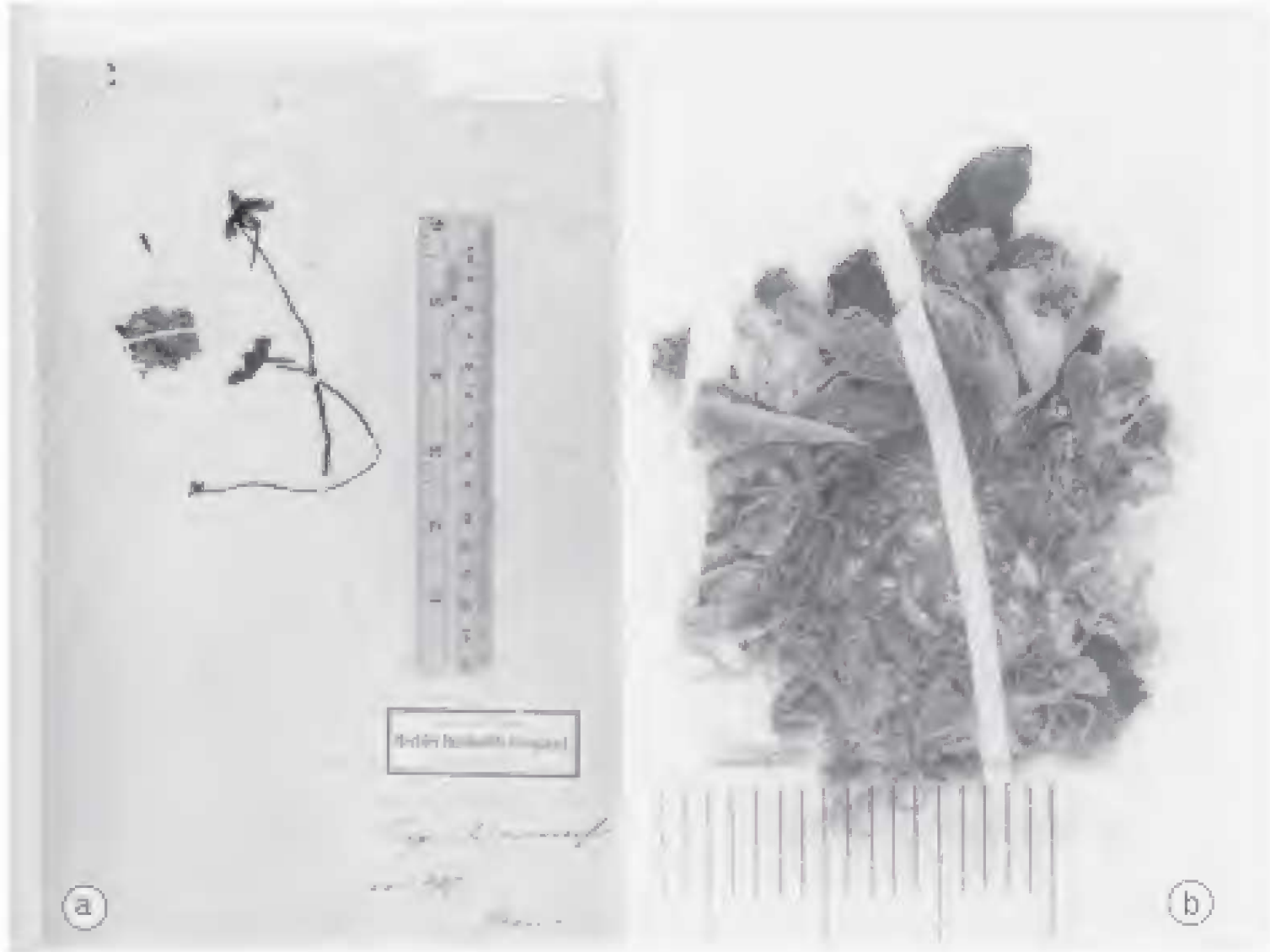
Fig. 1. a. Fotografía del ejemplar tipo de Pinguicula moranensis H.B.K. depositado en el Museo Nacional de Historia Natural de París. b. Ampliación de la "roseta de invierno" del tipo de P. moranensis H.B.K. Se aprecia la forma espatulada de las hojas con el ápice redondeado y restos de suelo blanco de apariencia calichosa.

edad tienen algunos recuerdos de la misma; sus ruinas se encuentran cerca de la población de Real del Monte, en donde se exploró en busca de alguna población de Pinguicula moranensis .